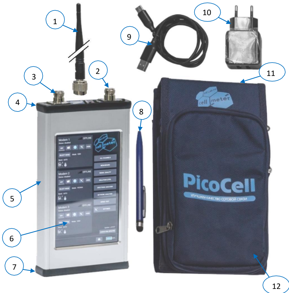
Рисунок 1. Комплектация и внешний вид прибора.